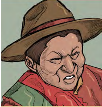
EL ALCALDE DEL MUNICIPIO.

EL RESULTADO ENFURECIÓ AL ALCALDE Y A OTROS DOS DE SUS SEGUIDORES. DECIDIERON IMPEDIR Y OBSTACULIZAR SU TRABAJO.