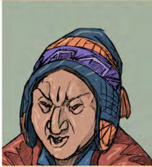
UNO DE LOS CONCEJALES,