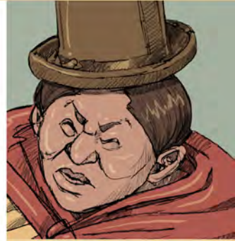
UNA DE LAS CONCEJALAS.